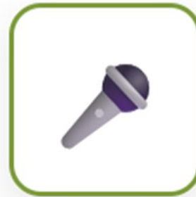
コミュニケーション