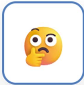
クリティカル・シンキング