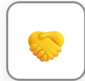
コラボレーション