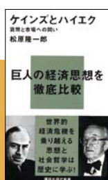
② ケインズとハイエク：貨幣と市場への問い 松原隆一郎 講談社現代新書 2011年12月