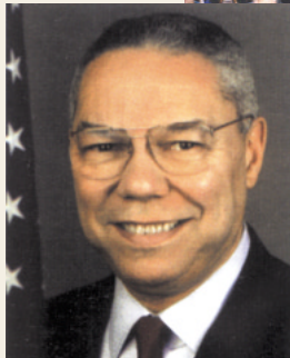
前米国国防長官 コリン・パウエル氏が 基調講演(9日)