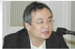
成瀬茂夫氏 経済産業省企画官